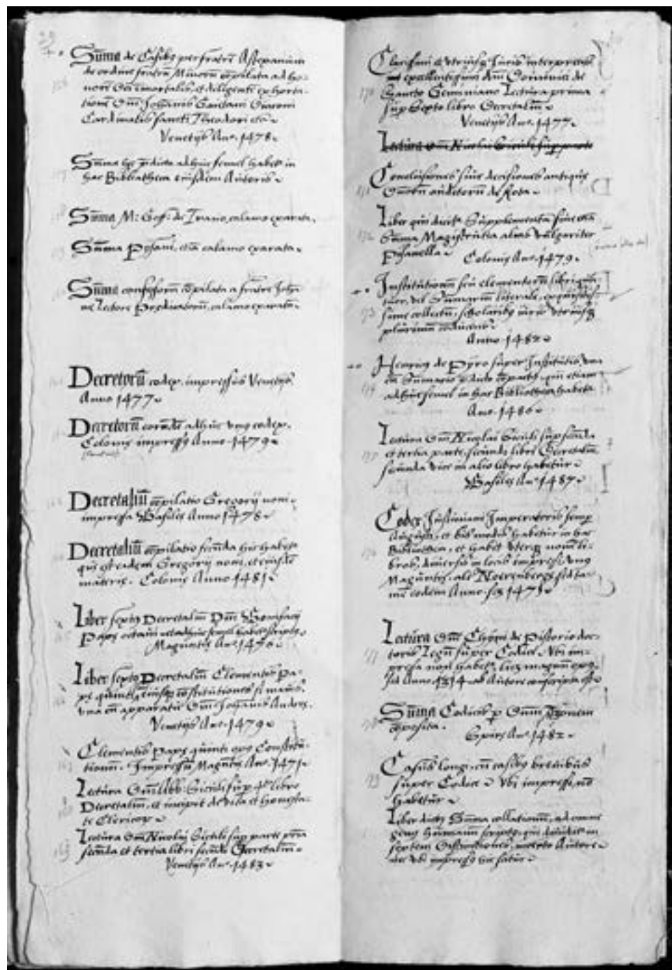
Catalogus Cantzen, pp. 29-30